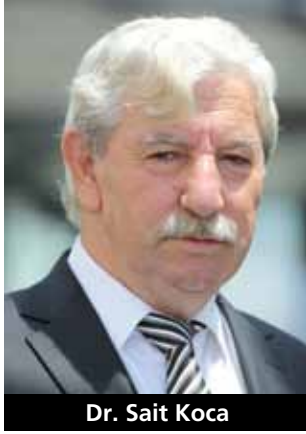
Dr. Sait Koca

Tavuk eti, insan beslenmesinde tartışılmaz bir öneme sahiptir. Tavuk etinin bu özelliği öncelikle besin maddeleri içeriği ve niteliğinden kaynaklanıyor. Ancak tavuk eti kırmızı ete kıyasla daha az yağlıdır, buna bağlı olarak da enerji değeri kırmızı etten daha düşüktür. Doymuş yağ ve kolesterol içeriği de daha azdır. Özellikle tavuğun beyaz etinin yağı çok azdır. Bu nedenle sağlıklı beslenme önerilerinde tavuk eti daha çok yer alıyor. Ülkemiz, kanatlı eti sektörü sahip olduğu potansiyel ile dünya oyuncusu olmaya aday bir ülke konumunda. Piliç